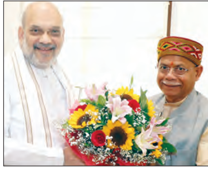
हिमाचल प्रदेश के राज्यपाल शिव प्रताप शुकल ने नई दिल्ली में केन्द्रीय गृह मंत्री अमित शाह से शिष्टाचार भेंट की।